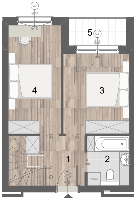
POZIOM 0 MIESZKANIA